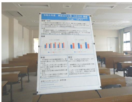
固定機に載せてみたイメージ。 固定機の床からの高さが約 75cm。 その上に左記イーゼルを載せます。 (※ この写真は、大村高校視聴覚室で会場をイメージして撮影。)